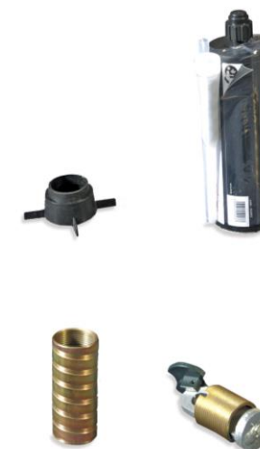
Composition Réf. 2000