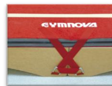
Bandes auto-agrippantes et pions métalliques