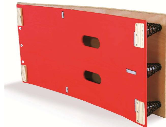
Châssis dynamique avec poignées de portage intégrées