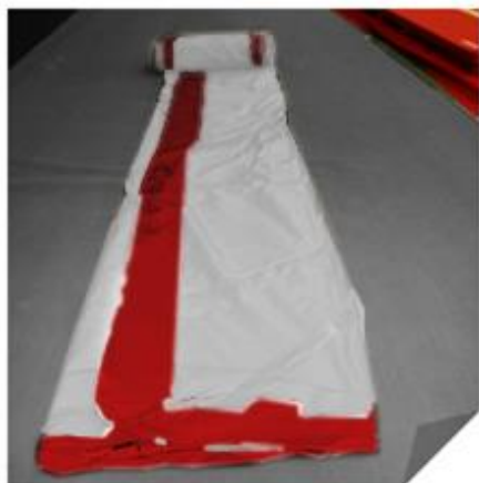
3. Déplier la piste

Piste à déplier et replier à plat pour une meilleure utilisation