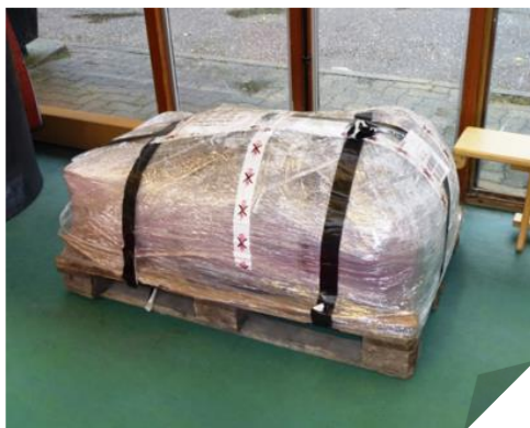
1. Réceptionner la piste