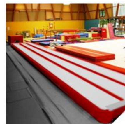
5. Utiliser la piste

Des bandes auto-agrippantes sur les 2 largeurs pour ajouter des matelas de réception