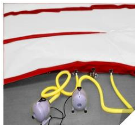
4. Gonfler la piste