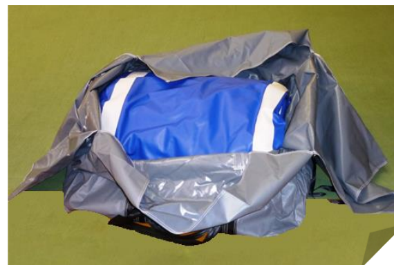
2. Déballer et contrôler les colis