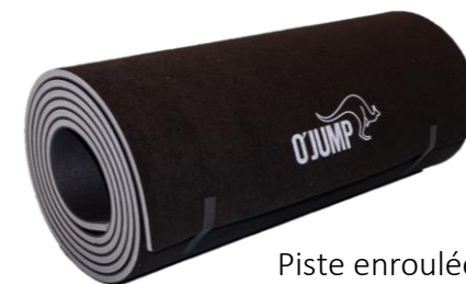
Piste enroulée = gain de place