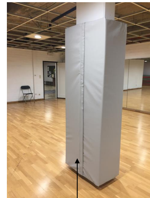
Fermeture par bandes auto agrippantes

Pour toutes demandes spécifiques, nous consulter