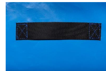
Poignée de portage