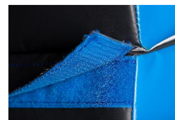
Bande auto-agrippante de liaison