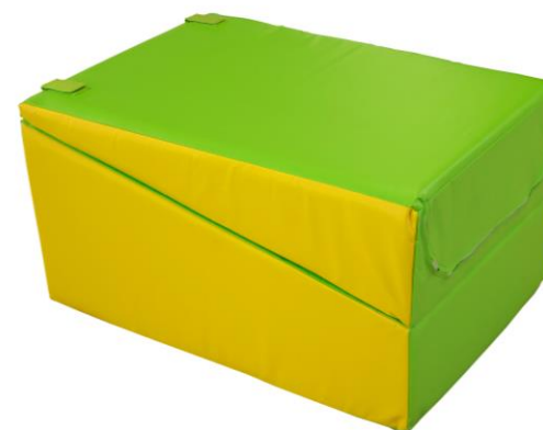
Ref. 0289 , pliée en deux